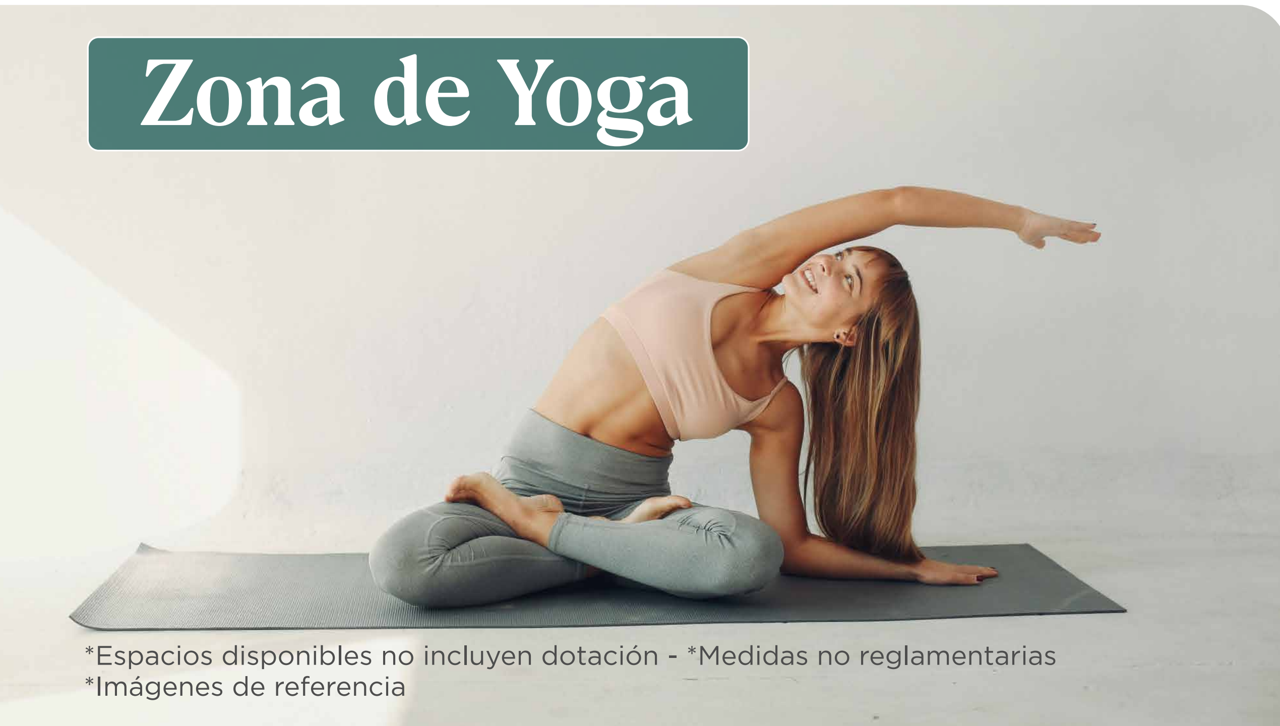
Zona de Yoga

*Espacios disponibles no incluyen dotación - *Medidas no reglamentarias *Imágenes de referencia